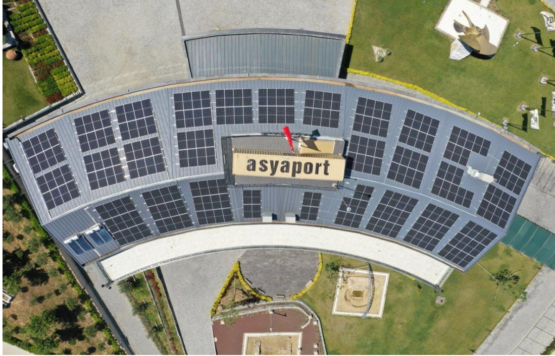
Yönetim Binası GES

ASYAPORT; stratejik düşünce, yenilikçi teknoloji, dikkatli yatırım, kararlar ve sürekli iyileştirmeye dayalı iş stratejileri ile, kendi ihtiyaçlarını karşılayabilecek sürdürülebilir bir liman olmayı hedeflemektedir. Bu hedefler doğrultusunda yenilenebilir enerji kaynaklarına yatırımlarını hız kesmeden devam ettirmektedir.