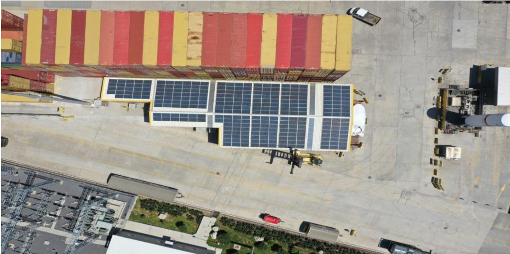
Enerji Binası GES